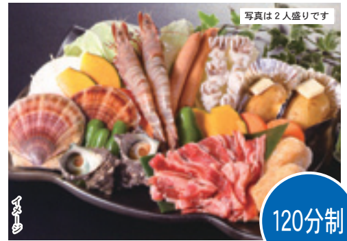
写真は2人盛りです

※キャンセルは 5月12日(木) までに必ずふくふくセンターへご連絡ください。 それ以降のキャンセルについては参加費(全額)を和歌山マリーナシティ 黒潮市場へお支払いいただきます。